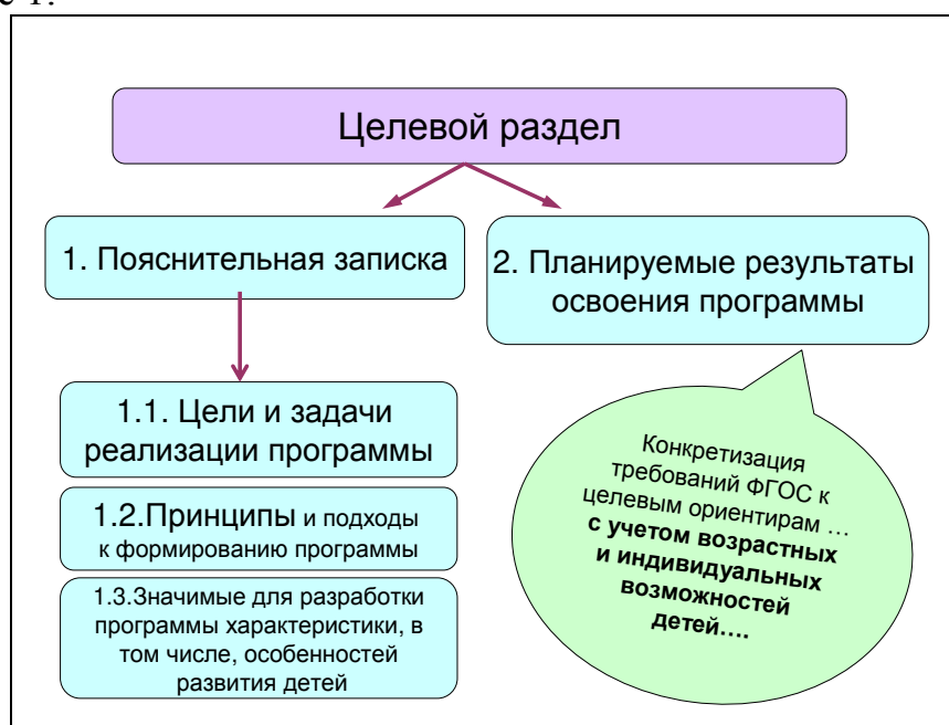
Схема 1. Структура целевого раздела Программы.

Проектирование основной образовательной программы начинается с Целевого раздела. Его структура в соответствии со Стандартом представлена на Схеме 1.