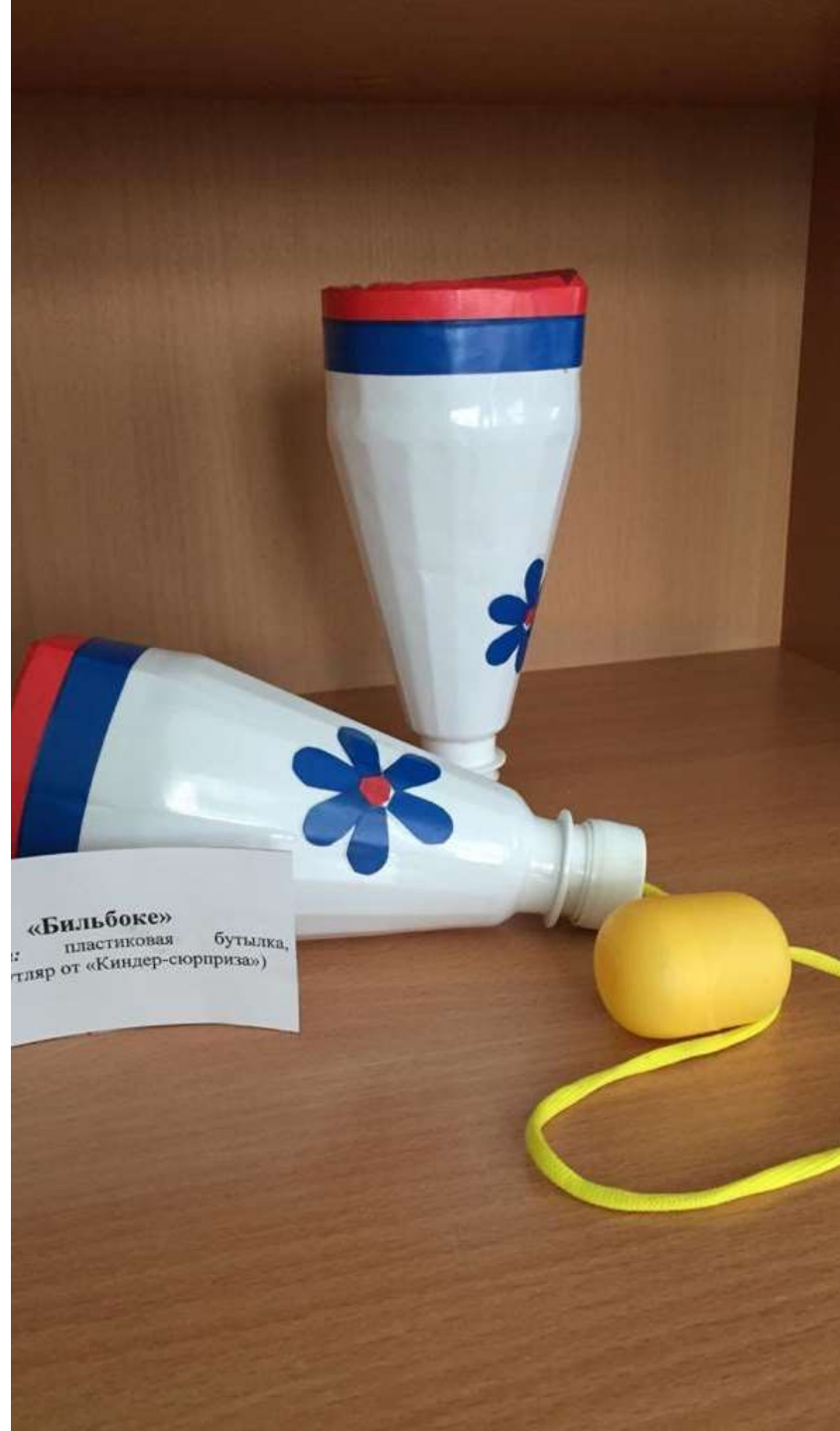
«Бильбоке» пластиковая бутылка, шарик от «Киндер-сюрприза»