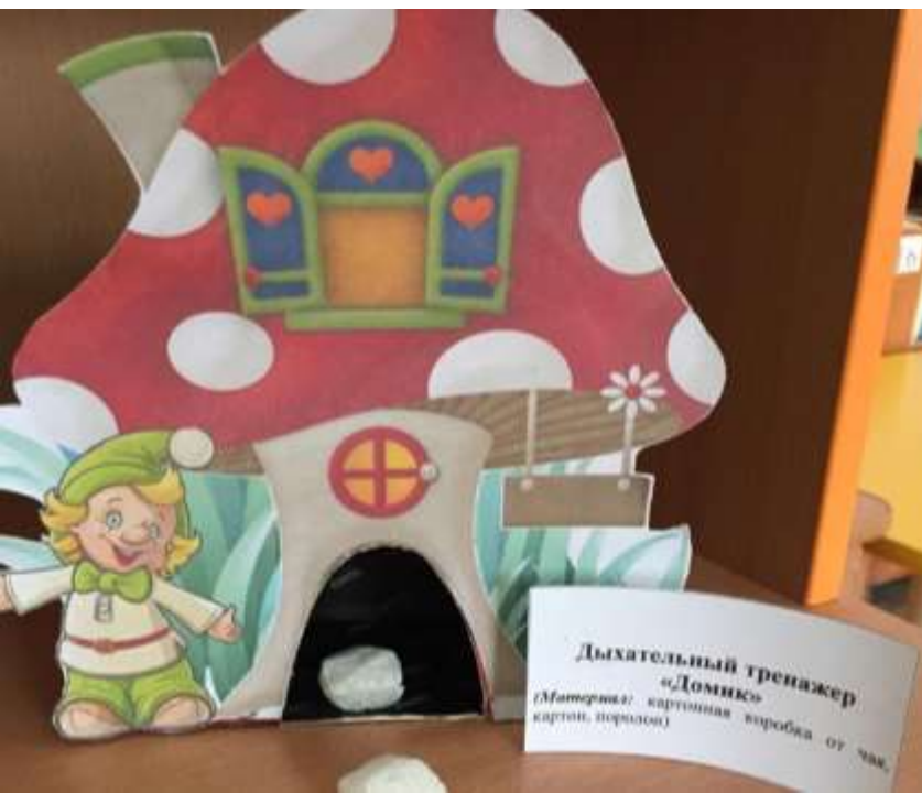
Дыхательный тренажер «Домик» (Материал: картонная коробка от чая, картон, поролон)