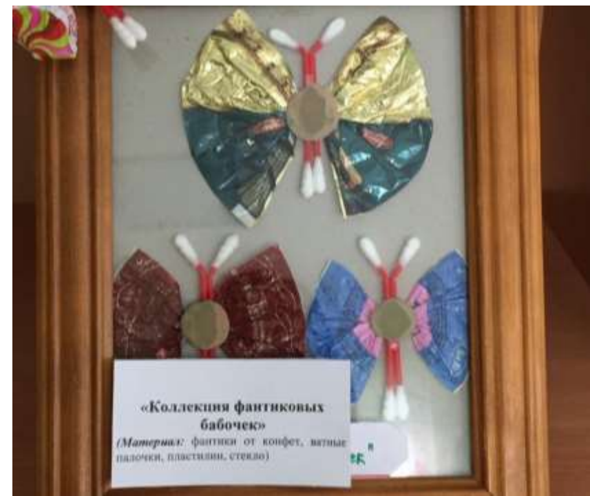
«Коллекция фантиковых бабочек» (Материал: фантики от конфет, ватные палочки, пластилин, стекло)