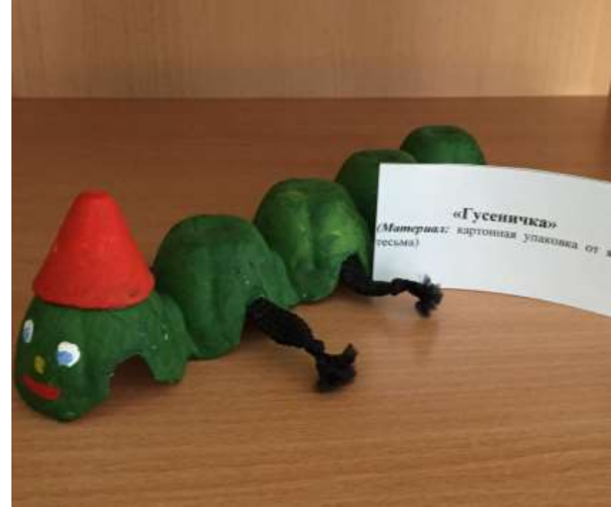
«Гусеничка» (Материал: картонная упаковка от чая, краска)